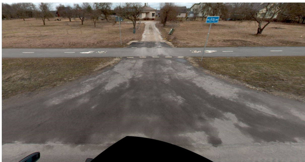
Joonis 2. Vaade Ilmatsalu tee 19 kinnistu riigitee ristumiskohale ning juurdepääsuteele (seisuga märts 2023)

Võttes arvesse oluliste puuduste esinemist projektis ning EhS § 70 lg 2 ja lg 3 ning § 99 lg 3 ja lähtudes kliimaministri 17.11.2023 määrusest nr 71 „Tee projekteerimise normid“, jätame ehitusloa kooskõlastamata.